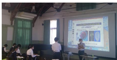
前回のサイエンスコミュニケーションの様子